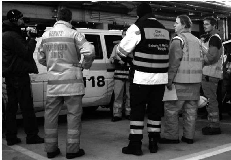
Fig. 3: Rapport de coordination durant l'exercice final

La mise en place de la plateforme d'apprentissage en ligne n'a été possible que grâce aux sponsors (sponsor prin-