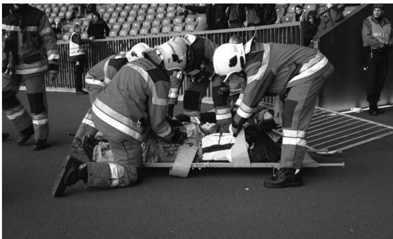
Fig. 2: Extrait du scénario de l'exercice final

Les cours CEFOCA/SFG rencontrent un succès réjouissant. Au total, ce sont en effet 150 personnes qui auront suivi les cours SFG en langue allemande et 130 les cours CEFOCA en langue française durant l'année 2008 (Tableau 1). Le déploiement logistique pour le cours SFG-B est tel qu'il n'est malheureusement pas possible de le dédoubler avec les moyens actuellement disponibles. L'offre de 35 places de cours par an en langue allemande devrait toutefois couvrir le besoin annuel en perfectionnement à long terme. Les cours de base en la matière ont dans l'intervalle été consolidés et optimisés sur le plan qualitatif, grâce surtout au feedback des participants. La certification de ces derniers a elle aussi été réglée. D'ici à la fin de l'année 2008, le règlement concernant la formation continue CEFOCA-SFG (RFC CEFOCA-SFG) aura été ratifié. On saura alors également ce que les participants devront régulièrement suivre comme cours de formation continue pour renouveler leur diplôme. La plateforme CEFOCA-SFG va de plus lancer sa propre offre de perfectionnement, sous la forme tant de nouveaux modules d'apprentissage en ligne que de